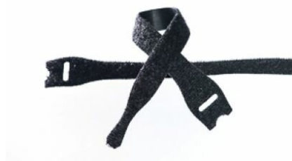
Abbildungen ggf. ähnlich