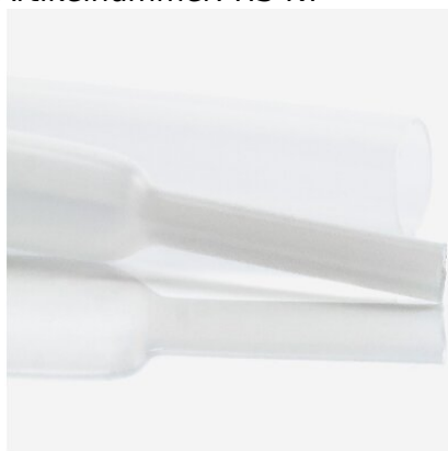
Abbildungen ggf. ähnlich