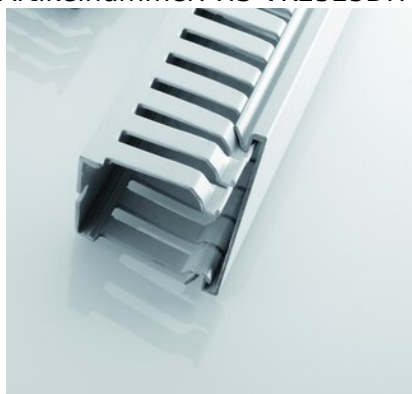
Abbildungen ggf. ähnlich