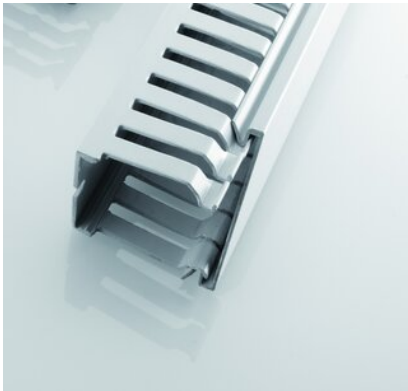
Abbildungen ggf. ähnlich