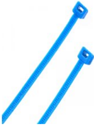
Abbildungen ggf. ähnlich