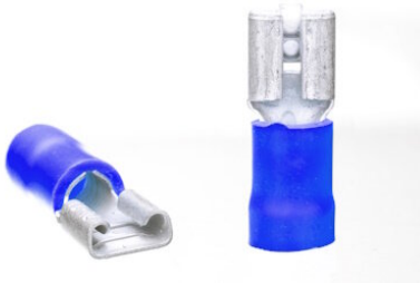
Abbildungen ggf. ähnlich